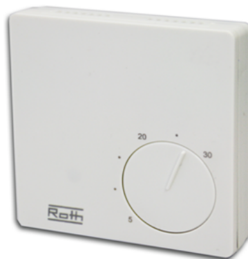
Basicline H 230 V Basicline H 24 V